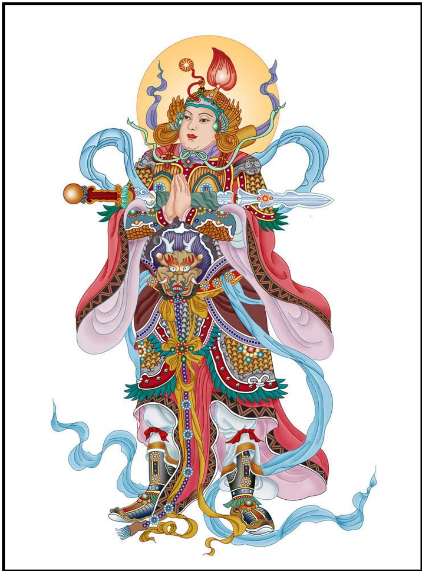
NAM MÔ HỘ PHÁP VI ĐÀ TÔN THIÊN BỒ TÁT